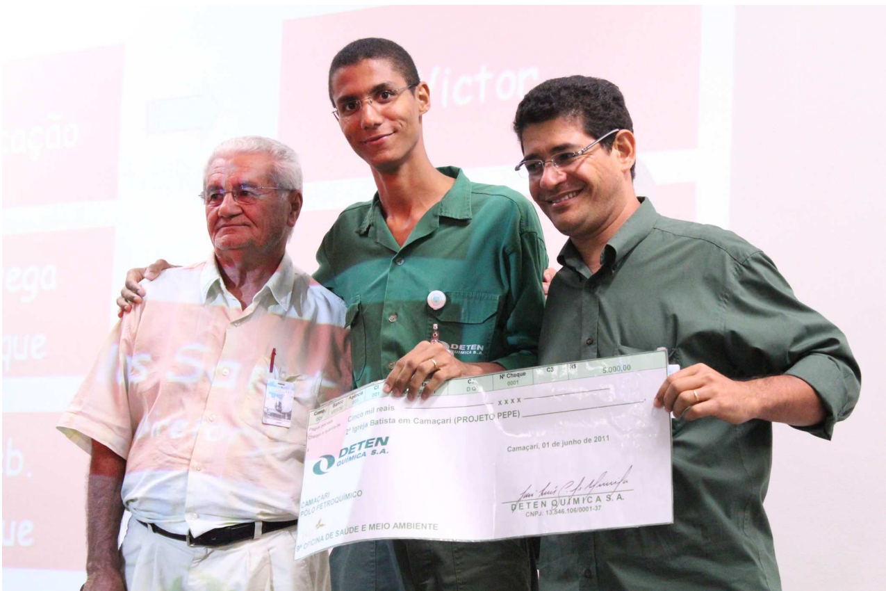
Victor/PSQ entrega o Cheque Verde para o representante do Projeto Pepe - 2ª Igreja Batista de Camaçari

Programa Coleta Seletiva - Como resultado da venda de sucata metálica, foram distribuídos R$ 25.000,00 (vinte cinco mil reais), em quotas de R$ 5.000,00 (cinco mil reais), por meio do “cheque verde” , para 5 entidades: uma localizada em Dias d'Ávila: Associação Beneficente - EDUCAVIDA; duas em Camaçari: Centro Comunitário de Desenvolvimento Recanto das Árvores, Projeto Pepe - 2ª Igreja Batista de Camaçari; uma em Simões Filho: Instituição Lar Irmã Benedita Camurugi e; uma em Salvador: VIDA - Valorização Individual do Deficiente Anônimo. No total foram enviados aproximadamente 11 toneladas de papel, papelão, plástico e vidro para a Cooperativa de Matérias Recicláveis de Camaçari – COOPMARC. O material recolhido é doado a esta cooperativa, que ajuda na subsistência de aproximadamente 20 pessoas, o que tem sido motivo de orgulho para a comunidade interna. Além desses materiais, a DETEN recicla lâmpadas, óleo lubrificante, pilhas e baterias, entre outros.