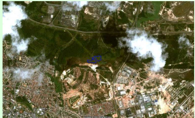
Vista aérea do projeto