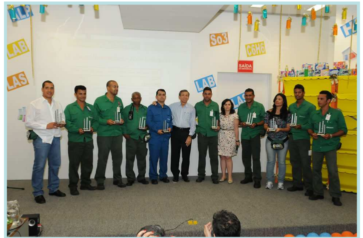
Premiação Oficina de Ideias e Inovações

A DETEN reconheceu e premiou os empregados que apresentaram as melhores ideias e inovações que geraram impactos econômicos ou de relevância organizacional. Dentre as Ideias/Inovações registradas, 28 foram implantadas , das quais 10 foram premiadas .