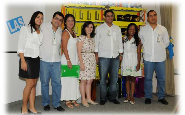
Apresentadores do evento