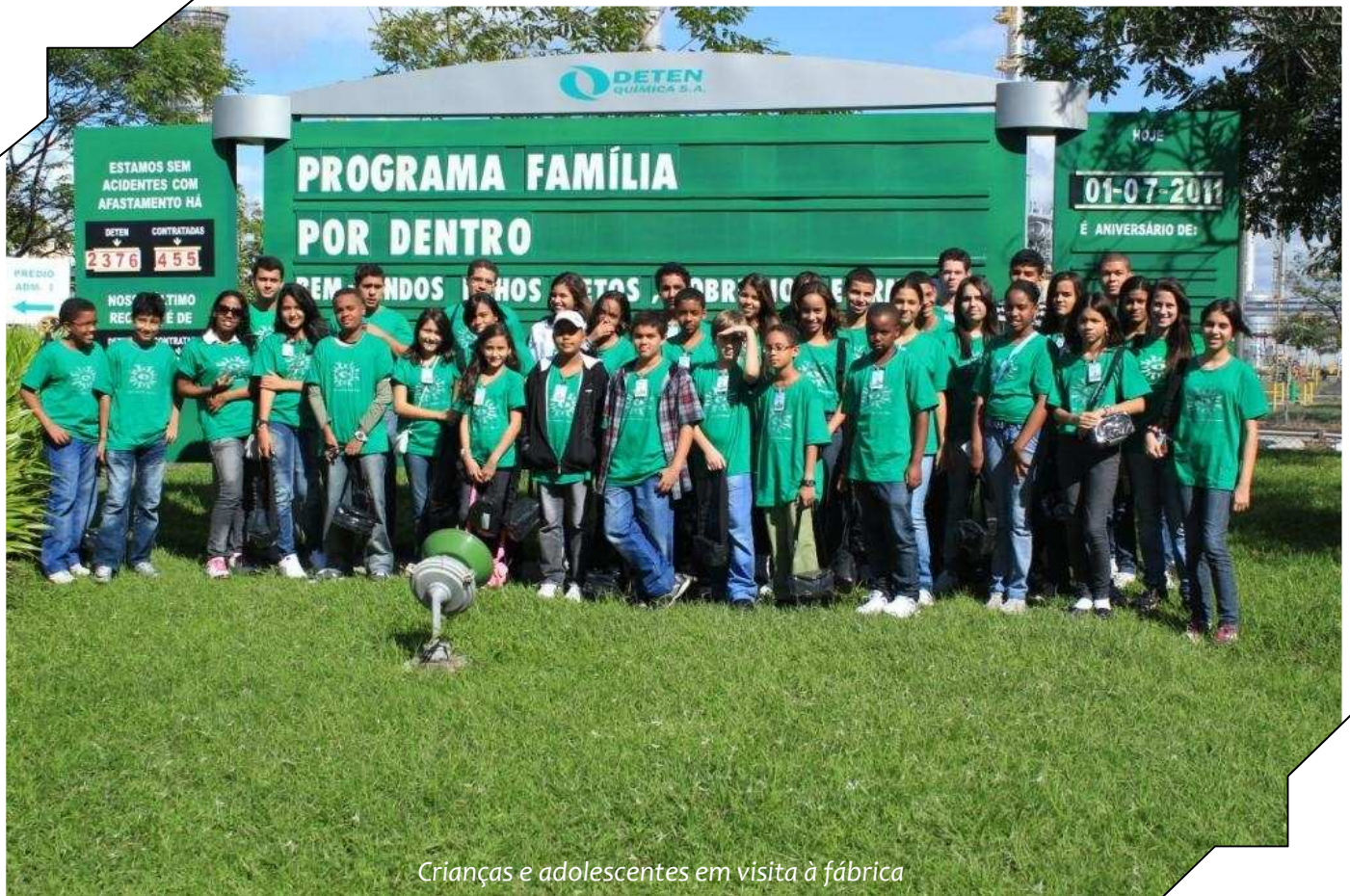
Crianças e adolescentes em visita à fábrica