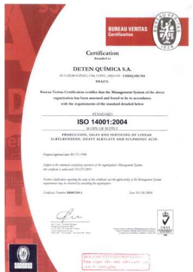
Certificado da ISO 14001