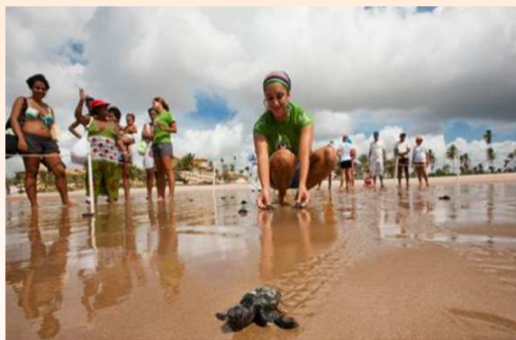
Soltura de filhotes