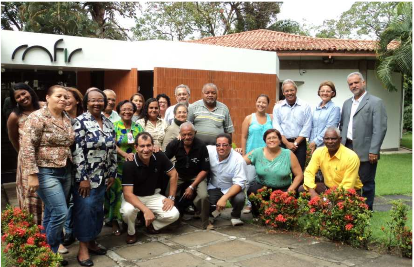
Representantes do Conselho reunidos no COFIC