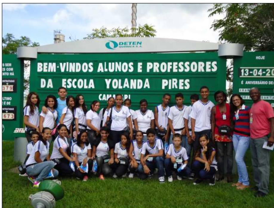
Visita dos Estudantes da Escola Yolanda Pires (Camaçari)