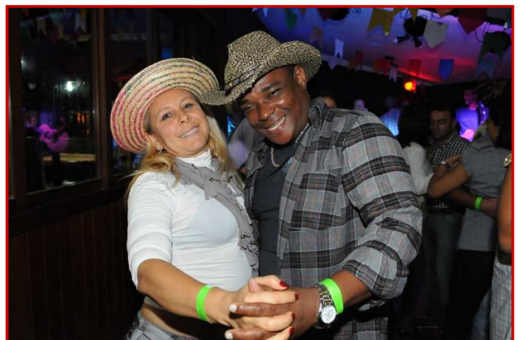
Confraternização de São João

A Empresa investe em apoio ao Grêmio de Empregados na promoção de confraternizações tradicionais (Natal, São João, Dia das Mães, Dia dos Pais e Dia das Crianças). O GREDE oferece aos associados diversas opções de lazer e convênios com clube social, estabelecimentos comerciais e escolas.