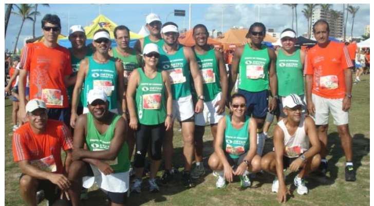
Circuito Adidas - Etapa Verão - 18/12

Em quatro anos, o número de participantes quase dobrou, passando de 16 para 29 em 2011, representando mais de 10% do quadro de empregados da DETEN . Este resultado impressiona, mas não é mais impactante do que a quantidade de quilômetros percorridos ao longo de cada ano.