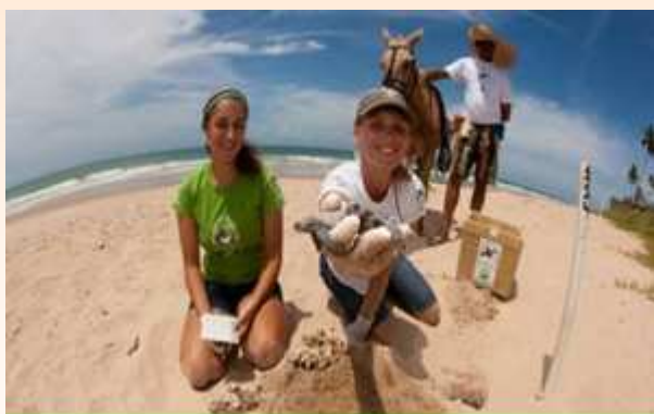
Base de Arembepe

TAMAR – Base Arembepe - Apoio ao programa brasileiro de preservação das tartarugas marinhas, com 31 anos de atuação e que tem como missão proteger as cinco espécies de tartarugas que ocorrem no Brasil. Em 2011, 2.348 tartarugas desovaram na área de cobertura da base de Arembepe/BA, resultando na liberação de 153.313 filhotes ao mar . Nesse período, foram registradas 63.489 participações de pessoas nos diversos programas desenvolvidos, sendo: 20.603 visitantes na base, 2.204 estudantes visitaram a base, 1.040 em palestras, 1.906 em eventos comunitários, 6.519 em eventos de soltura dos filhotes, 29.085 em exposições, 543 estudantes da escolinha do TAMAR e foram realizados 1.589 atendimentos especiais. Em todo o Brasil, as comunidades circunvizinhas estão fortemente comprometidas com o projeto, visto que 80% das pessoas envolvidas com o manejo e a preservação das tartarugas são moradores das comunidades costeiras. Na base de Arembepe, 70% são moradores locais e 94% das comunidades circunvizinhas são atingidos diretamente pelas ações socioambientais do projeto.