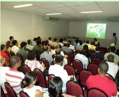
Seminário de Restauração Ecológica Comunitária

Apoio ao INCECC - Instituto Corredor Ecológico Costa dos Coqueiros. Em 2011, em vez de ampliar a quantidade, investimos no acompanhamento do crescimento das mudas plantadas e no plantio de mais 130.000 mudas de árvores típicas da região, parte dessas em áreas degradadas, para recuperação do Anel Florestal do Polo Industrial de Camaçari e sua futura ligação ao Corredor Ecológico. O plantio das mudas e o acompanhamento das áreas reflorestadas são feitos com a mão de obra das comunidades residentes no entorno do Polo. A DETEN patrocinou a realização do Sétimo Seminário de Restauração Ecológica para capacitação dos moradores da comunidade e garantir a manutenção nas áreas e o combate aos incêndios florestais.