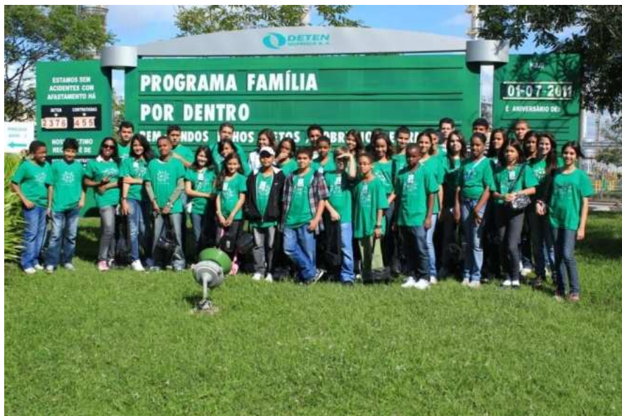
Crianças e adolescentes em visita à fábrica

O programa tem por objetivo proporcionar a oportunidade as crianças e adolescentes conhecerem o ambiente de trabalho de seus familiares , permitindo assim a integração família e empresa . No dia 1º de julho, a DETEN recebeu a visita de 41 crianças e adolescentes, filhos, netos, irmãos ou sobrinhos dos empregados.