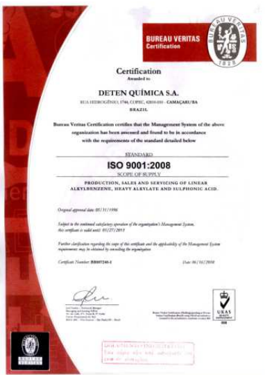
Certificado da ISO 9001

Em abril de 2011, a DETEN com seu Sistema Integrado de Gestão Avançada - SIGA foi submetida a Auditoria Externa de Manutenção nas normas: OHSAS 18001:2007, ISO 14001:2004 e ISO 9001: 2008 quando foi verificado que estamos atendendo a todos os requisitos das normas de Segurança e Saúde Ocupacional, Meio Ambiente e Qualidade.