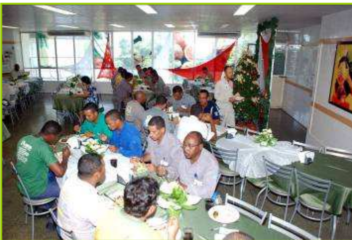
Refeitório em almoço festivo