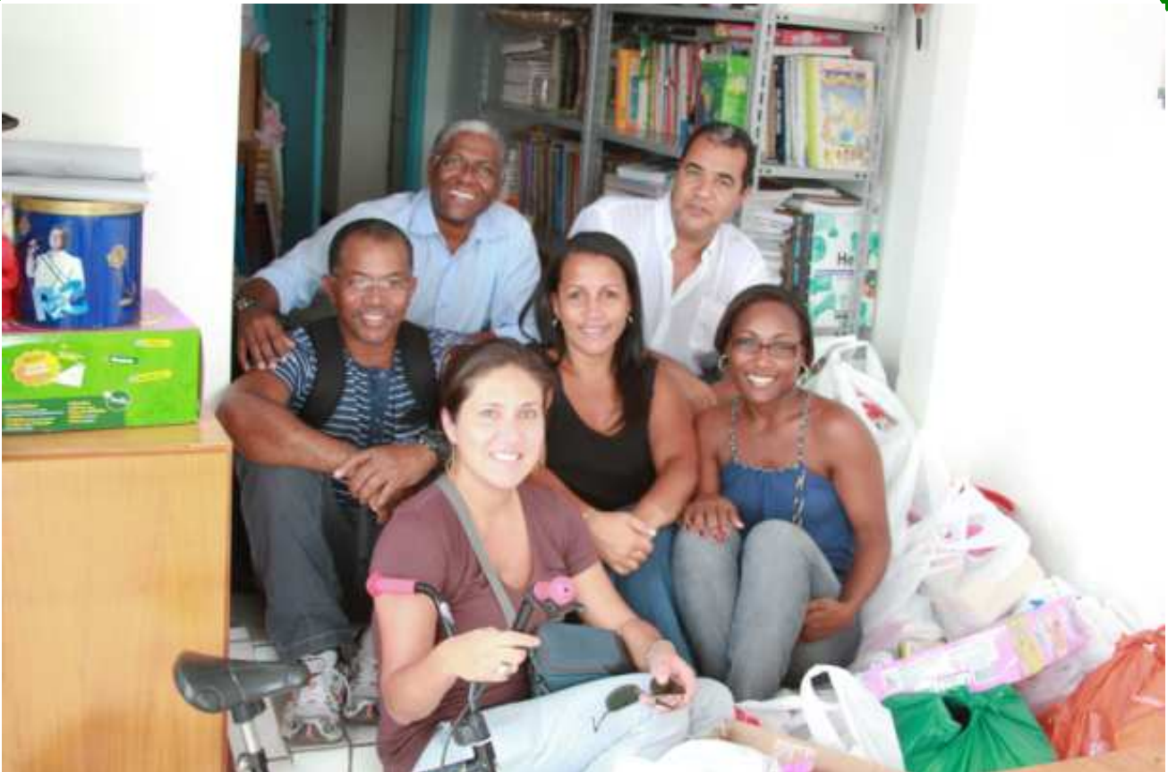
Coralistas participam de ação voluntária

O Coral DETEN arrecadou e doou à Creche Comunitária Recanto das Árvores, em Camaçari: 65 itens de higiene pessoal, 38 itens de material de limpeza, 22 itens de alimentos e 18 itens de brinquedos, como parte do Projeto Arte Solidária .