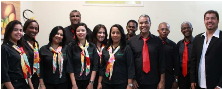
Apresentação do Coral no IX FEPAC em João Pessoa

Em 2011, a DETEN manteve a prática instituída desde 1981 e pagou bonificação de 5,975 salários aos seus empregados, sob a forma de PLR - Participação nos Lucros e Resultados, como parte de seu Programa de Remuneração Variável.