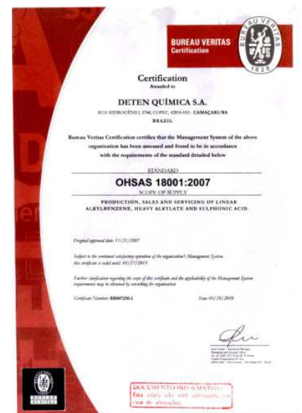
Certificado da OHSAS 18001