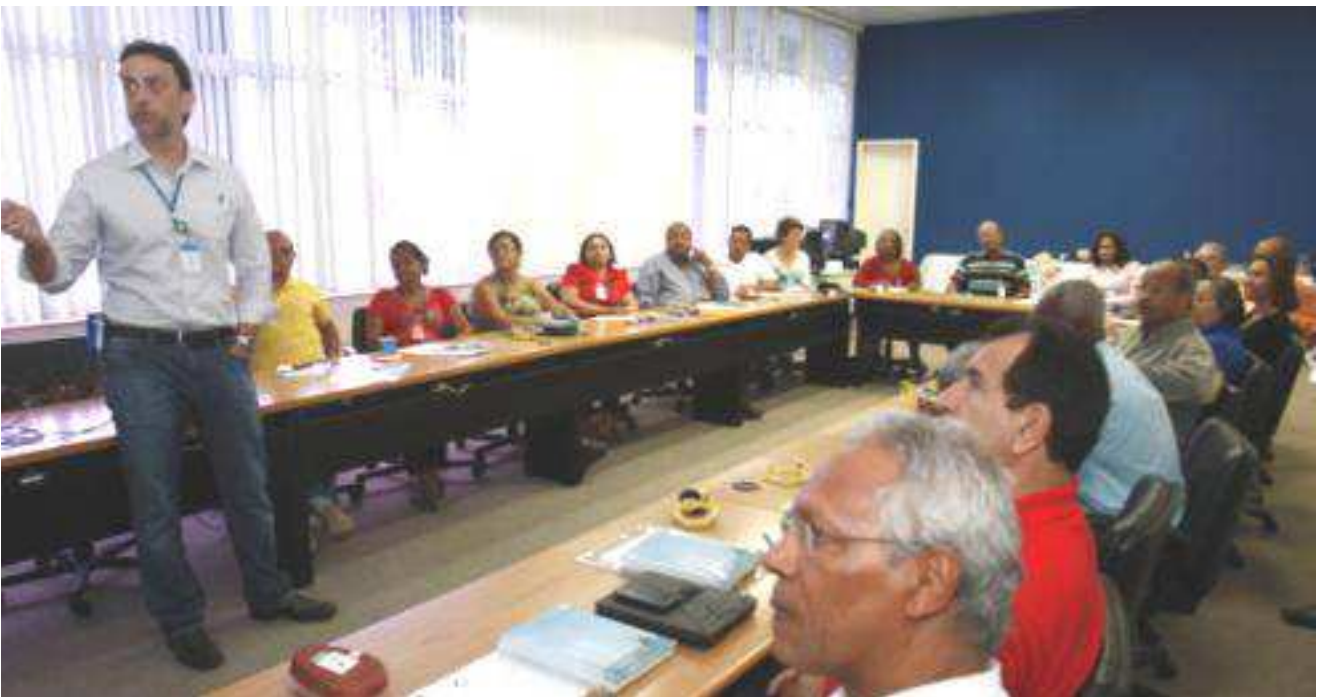
Representantes do Conselho reunidos na BRASKEM