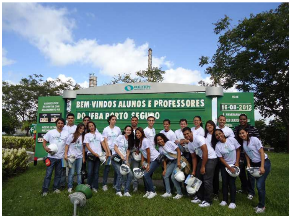
Visita dos Estudantes do IFBA Porto Seguro (BA)

Ver de Dentro – Programa de visitas às empresas do Polo Industrial para manter as comunidades informadas sobre as atividades e controles de riscos do Complexo Industrial. A DETEN foi visitada em duas ocasiões, totalizando 57 pessoas entre alunos e professores das escolas Padre Torrend de Dias D'Ávila e do IFBA – Porto Seguro (Alunos do curso Técnico em biocombustíveis).