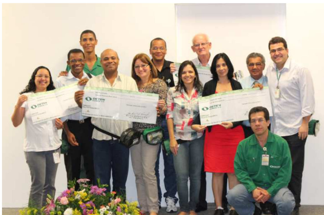
Entrega o Cheque Verde para as Entidades selecionadas em 2012

Programa Coleta Seletiva - Como resultado da venda de sucatas metálicas, foram distribuídos R$ 16.000,00 (dezesesseis mil reais), em quotas de R$ 4.000,00 (quatro mil reais), por meio do “Cheque Verde” , para 4 entidades: três localizadas em Salvador: Casa de Repouso Bom Jesus, Lar da Criança e Associação Solidarieidade de Grupo de Apoio ao Paciente Portador de Câncer - ASGAP; uma em Simões Filho - Centro Comunitário Batista Salamina - CECBASA. Em 2012 foram enviadas aproximadamente 16 toneladas de papel, papelão, plástico e vidro para a Cooperativa de Matérias Recicláveis de Camaçari – COOPMARC. O material recolhido é doado a essa cooperativa, que ajuda na subsistência de seus integrantes, o que tem sido motivo de orgulho para a comunidade interna. Além desses materiais, a DETEN recicla lâmpadas, óleo lubrificante, pilhas e baterias, entre outros.