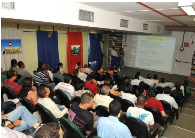
Empregados, estagiários, terceiros e convidados lotaram o auditório