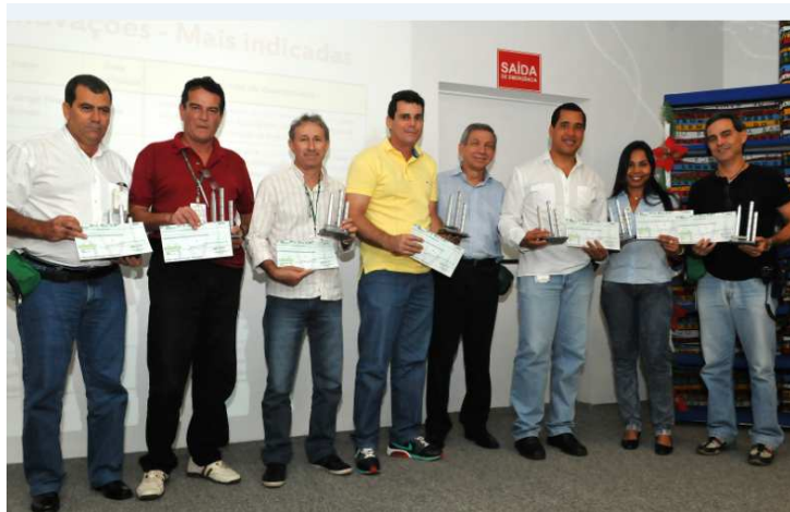
Premiação do Oficina de Ideias e Inovações

A DETEN reconheceu e premiou os empregados que apresentaram as melhores ideias e inovações que geraram impactos econômicos ou de relevância organizacional. Dentre as Ideias/Inovações registradas, 14 foram implantadas , das quais 7 foram premiadas .