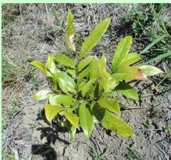
Planta típica da Região

Fábrica de Florestas - Corredor Ecológico – A partir de setembro de 2012 o INCECC passou a se chamar Instituto Fábrica de Florestas – IFF , mantendo seu foco de ações na Educação e Conservação Ambiental, especialmente na Mata Atlântica e no Anel Florestal do PIC. Cerca de 6,5 hectares foram incorporados ao processo de restauração florestal do projeto, com o plantio de 14.500 mudas típicas da região . Outras 25.000 mudas foram disponibilizadas para plantio por parceiros, totalizando aproximadamente 40 mil mudas plantadas em 2012, o que representa 22% das 176 mil mudas produzidas. Neste ano o IFF, apesar de diminuir a quantidade de mudas produzidas, alcançou a diversidade de 100 espécies nativas. Das mudas plantadas, 5.000 representam o patrocínio que a DETEN renova anualmente com o Projeto. Estas mudas foram plantadas nas margens do Riacho bandeira, principal afluente do Rio Camaçari, e correspondem a 2 hectares. Para disseminar as ações e capacitar comunidades, a DETEN patrocinou também a realização do 9º Seminário de Restauração Ecológica (julho, 2012), para 38 participantes que conheceram a área em processo de restauração, no Anel Florestal, realizaram um plantio simbólico e aprenderam sobre a importância das ações de manutenção para o sucesso do restauro.