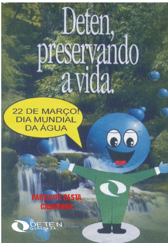
Cartilha distribuída para alunos

Em comemoração ao Dia Mundial da Água (22 de março, a DETEN realizou campanha voltada para “Educação e Conscientização”. Com esse foco, foi realizada palestra sobre a importância da preservação da água na Escola Normélio Moura – em Dias d’Ávila, buscando a conscientização do público jovem e divulgação das ações realizadas pela DETEN para a preservação deste recurso. Internamente, realizou campanha com distribuição de cartilhas, adesivos e jornais com dicas e cuidados para preservação da água, além de divulgação dos projetos da DETEN (em pôsteres) e sobre redução de água para toda a força de trabalho.