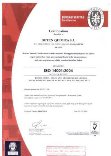
Certificado da ISO 14001