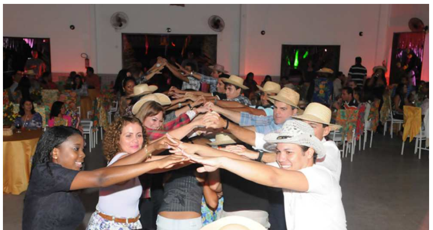
A quadrilha anima ao festa todos os anos

GREDE oferece aos associados diversas opções de lazer e convênios com clube social, estabelecimentos comerciais e escolas.