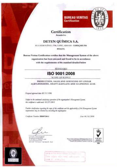
Certificado da ISO 9001

Em maio de 2012, a DETEN submeteu seu Sistema Integrado de Gestão Avançada - SIGA à Auditoria Externa de Manutenção nas normas: OHSAS 18001:2007, ISO 14001:2004 e ISO 9001: 2008, atendendo respectivamente a todos os requisitos da norma de Segurança e Saúde Ocupacional, Meio Ambiente e Qualidade.