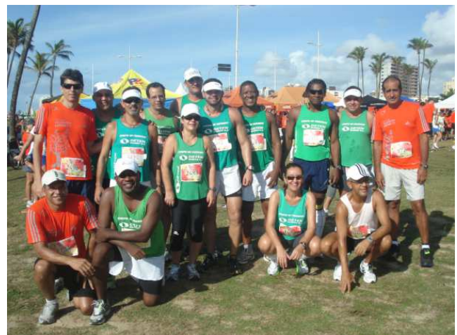
Grupo correu 1.412 km em 2012

Em quatro anos, o número de participantes quase dobrou, passando de 16 para 29 em 2012, representando mais de 10% do quadro de empregados da DETEN . Este resultado impressiona, mas não é mais impactante do que a quantidade de quilômetros percorridos ao longo de cada ano.