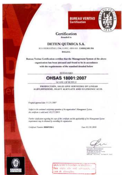
Certificado da OHSAS 18001