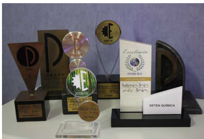
Troféus do Prêmio Polo – 2002 a 2012

Prêmio Polo de Segurança, Saúde Higiene e Meio Ambiente – Em março 2012 a DETEN passou pela auditoria externa, com base no Guia do Prêmio Polo do COFIC – Comitê de Fomento Industrial de Camaçari e obteve a maior pontuação entre as participantes na categoria Ouro , com 95,3% de conformidade, demonstrando o alinhamento da Empresa com as questões de SSHMA. Apesar do excelente resultado, foi efetuada análise crítica das recomendações da auditoria, envolvendo as lideranças e a força de trabalho, visando à melhoria contínua do sistema de gestão da Organização.