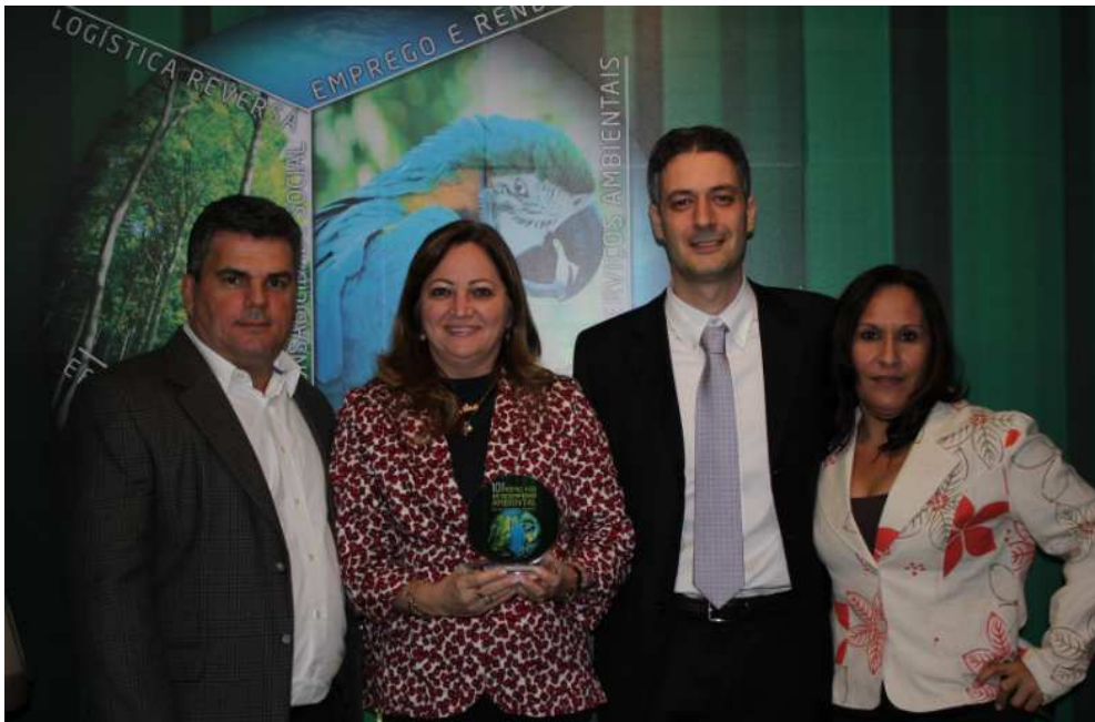
Entrega do Prêmio no Auditório da Fieb

Prêmio FIEB Ambiental – Em agosto 2012 a DETEN conquistou o Prêmio de Desempenho Ambiental na categoria de Responsabilidade Socioambiental na décima edição do prêmio FIEB – Federação das Indústrias do Estado da Bahia com o projeto “ Cheque Verde ”. Este projeto visa reciclar resíduos oriundos do processo industrial como sucatas metálicas e óleo lubrificante e reverte os valores em benefícios para Organizações Não-Governamentais - ONGs, que acolhem e cuidam de pessoas carentes.