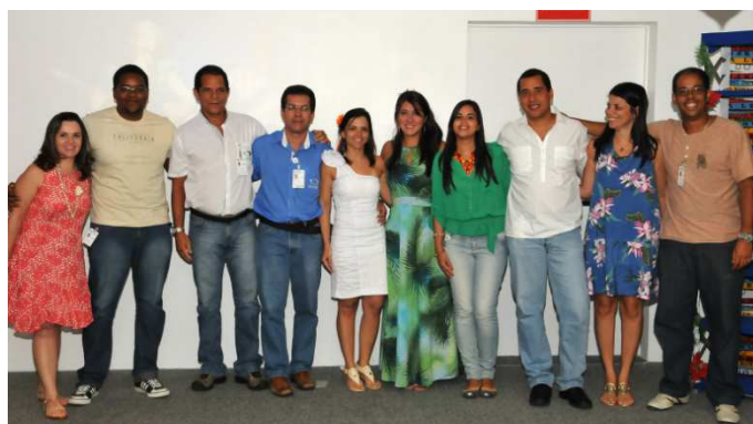
Apresentadores do evento

A DETEN homenageou os empregados que completaram 10, 15, 20, 25 e 30 anos de casa. Em 2011, 20 empregados foram reconhecidos e premiados .