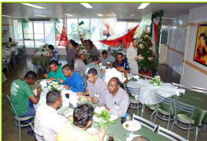
Refeitório em almoço festivo