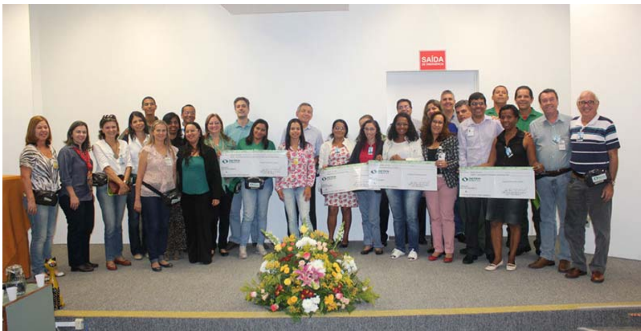
Entrega do Cheque Verde para as Entidades selecionadas em 2013

No total foram enviados aproximadamente 14 toneladas de papel, papelão, plástico e vidro para a Cooperativa de Matérias Recicláveis de Camaçari – COOPMARC. O material recolhido é doado a essa cooperativa, que ajuda na subsistência de seus integrantes, o que tem sido motivo de orgulho para a comunidade interna. Além desses materiais, a DETEN recicla lâmpadas, óleo lubrificante, pilhas e baterias, entre outros.