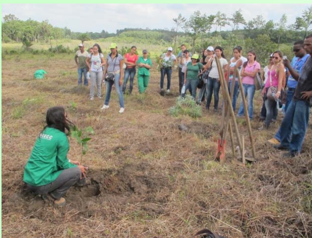
Plantio de mudas com participação da Comunidade

Dando continuidade a parceria, em 2013 o processo de restauração florestal contou com a produção e plantio de 5.000 mudas típicas da região , fica localizada em frente ao Centro de Pesquisa e Desenvolvimento (CEPED), e correspondem a 3,5 hectares . A vegetação da região estava em um estágio de degradação avançado, com acentuada erosão do solo e presença de ravinas, porém, apresenta potencial de regeneração. Para disseminar as ações e capacitar comunidades, a DETEN patrocinou também a realização do 10º Seminário de Restauração Ecológica (julho, 2013). Os participantes do evento foram pessoas das comunidades Mangueiral, Ficam II e Triângulo, escolhidas tendo em vista a proximidade e relação com o Anel Florestal, foco de ação do Instituto em Camaçari. Foi fornecido material didático, almoço e transporte até o local da aula prática, onde conheceram a área em processo de restauração, no Anel Florestal, realizaram um plantio simbólico e aprenderam sobre a importância das ações de manutenção para o sucesso do restauro.