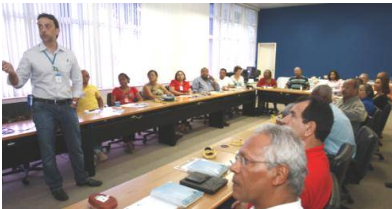
Representantes do Conselho reunidos na BRASKEM

Conselho Comunitário Consultivo - - Em dezembro de 1994, o Comitê de Fomento Industrial de Camaçari – COFIC - associação que representa as empresas do Polo Industrial de Camaçari - constituiu em um Conselho Consultivo, formado por representantes das comunidades vizinhas, com o objetivo de intensificar a aproximação do complexo industrial com essas comunidades. Funcionando há 19 anos, suas reuniões que acontecem a cada dois meses e tratam de temas como segurança industrial, saúde ocupacional proteção ambiental e responsabilidade social. Um indicador da boa relação das empresas do complexo industrial com as comunidades vizinhas são as participações ativas nas reuniões e contribuições dos participantes. Em 2013, o Conselho Consultivo reuniu-se 5 vezes.