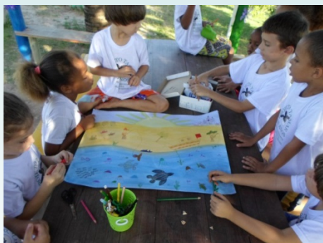
Escolinha do Tamar (Arquivo Tamar)

Em 2013, a DETEN manteve apoio ao programa brasileiro de preservação das tartarugas marinhas, com 33 anos de atuação e que tem como missão proteger as cinco espécies de tartarugas que ocorrem no Brasil. Em 2013, 992 tartarugas desovaram na área de cobertura da base de Arembepe/BA, resultando na liberação de 79.558 filhotes ao mar . Nesse período, foram registradas 45.237 participações de pessoas nos diversos programas desenvolvidos, sendo: 18.687 visitantes na base, 1.355 estudantes visitaram a base, 74 em palestras, 152 em eventos comunitários, 5.382 em eventos de soltura dos filhotes, 17.868 em exposições, 500 estudantes da escolinha do TAMAR e foram realizados 1.219 atendimentos especiais. Em todo o Brasil, as comunidades circunvizinhas estão fortemente comprometidas com o projeto, visto que 80% das pessoas envolvidas com o manejo e a preservação das tartarugas são moradores das comunidades costeiras. Na base de Arembepe, 70% são moradores locais e 94% das comunidades circunvizinhas são atingidos diretamente pelas ações