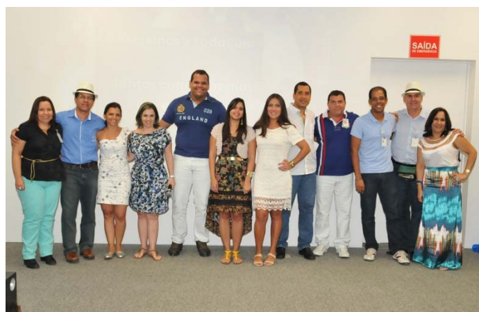
Apresentadores e Comissão Organizadora do evento

A DETEN homenageia os empregados que completaram 10, 15, 20, 25, 30 e 35 anos de casa. Em 2013, 39 empregados foram reconhecidos e premiados .