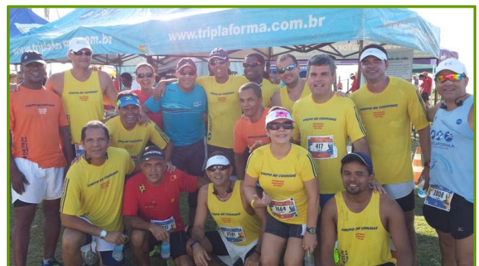
Membros do Grupo de Corridas DETEN

Em 2013, o grupo alcançou a marca de 2.148 km percorridos , com 258 participações em 44 provas diferentes, sendo que cada atleta do grupo percorreu, em média, 72 km durante o ano somente em competições, numa evolução média de 46% dentre todos os números.