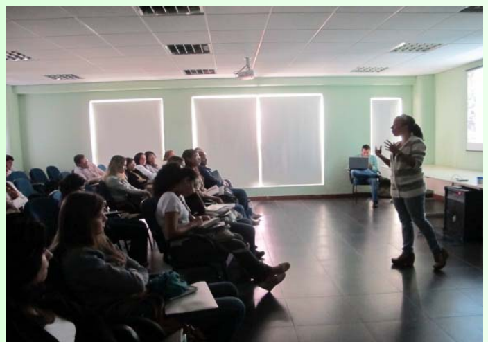
Seminário de Restauração Ecológica