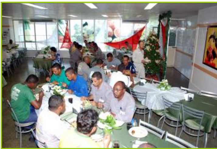
Refeitório em almoço festivo