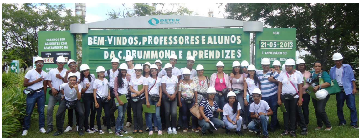
Alunos e professores da Escola Carlos Drummond de Dias d'Ávila iniciando visita à Deten