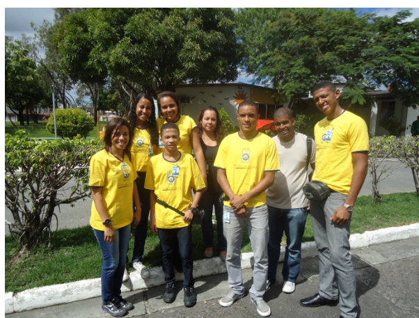
Jovens Aprendizes (maio/2013)