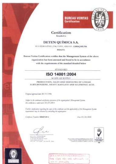
Certificado da ISO 14001