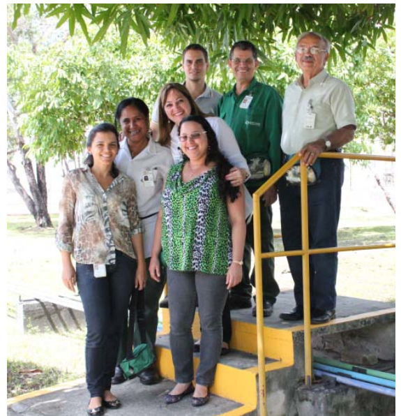
Comitê de Ergonomia

Ergonomia – Em 2013 foi reestruturado o Programa de Ergonomia da DETEN – PED e o Comitê de Ergonomia, elegendo um Coordenador, um líder do comitê e um consultor, além de representantes de várias áreas da organização, visando uma atuação multidisciplinar para identificação e solução de problemas ergonômicos para elevar a satisfação da sua força de trabalho nos seus ambientes e conseqüentemente a produtividade da empresa. O comitê se reúne quadrimestralmente e discute as principais melhorias na empresa, visando o conforto e o bem-estar do trabalhador. São realizadas inspeções semestrais em todas as áreas para verificar junto ao trabalhador possíveis problemas ergonômicos, além de reforço e/ou esclarecimento das principais orientações ergonômicas adotadas pela empresa.