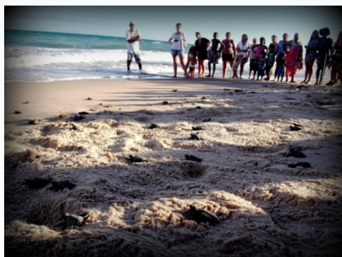
Soltura de filhotes