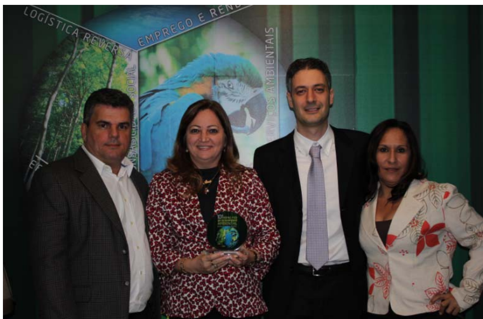
Entrega do Prêmio no Auditório da Fieb

Prêmio FIEB Ambiental – Em agosto 2012 a DETEN conquistou o Prêmio de Desempenho Ambiental na categoria de Responsabilidade Socioambiental na décima edição do prêmio FIEB – Federação das Indústrias do Estado da Bahia com o projeto “ Cheque Verde ”. Este projeto visa reciclar resíduos oriundos do processo industrial como sucatas metálicas e óleo lubrificante e reverte os valores em benefícios para Organizações Não-Governamentais - ONGs, que acolhem e cuidam de pessoas carentes.