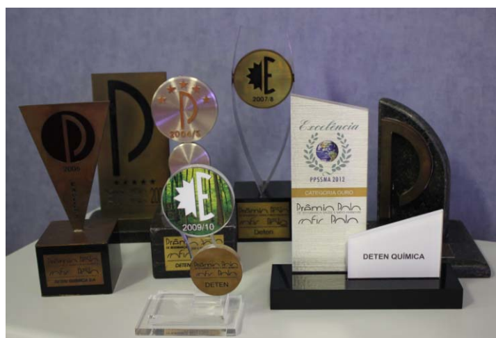
Troféus do Prêmio Polo – 2002 a 2012

Prêmio Polo de Segurança, Saúde Higiene e Meio Ambiente - Em maio 2013 a DETEN passou pela auditoria Interna, com base no novo Guia do Prêmio Polo do COFIC – Comitê de Fomento Industrial de Camaçari que foi acrescido de mais três Elementos: 17, 18 e 19. Entretanto, a Empresa se manteve no patamar de excelência, obtendo a pontuação de 90,84% de conformidade. Este resultado demonstra o alinhamento da Empresa com as questões de SSHMA.