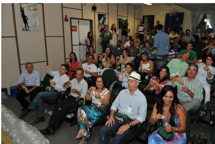
Diretores, empregados, estagiários, terceiros e convidados lotaram o auditório