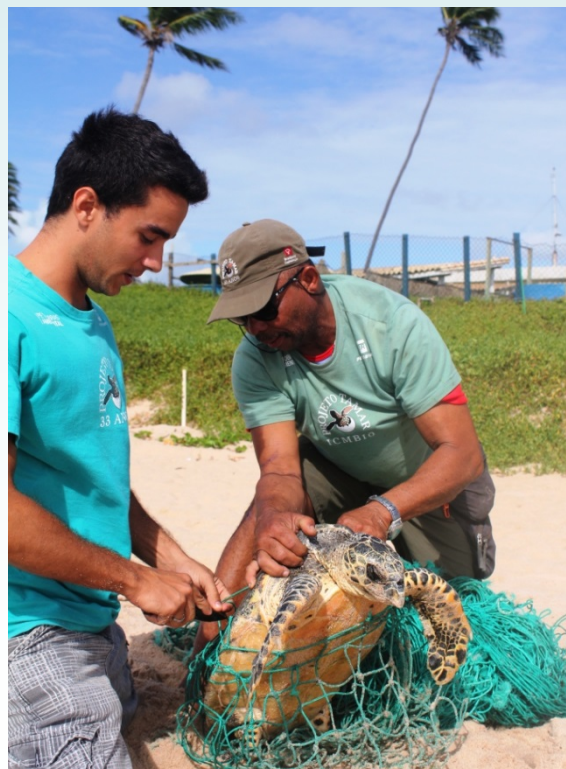
Atendimento à tartaruga