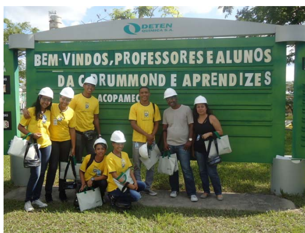
Jovens Aprendizes em visita à Deten (maio/2013)

A DETEN deu continuidade à sua participação na formação de adolescentes carentes em parceria com a Acopamec - Centro do Menor João Paulo II , associação das comunidades paroquiais de bairros carentes de Salvador (Mata Escura e Calabetão).