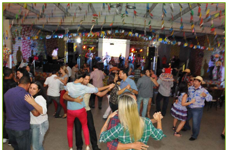
Evento de São João

A Empresa investe em apoio ao grêmio de empregados na promoção de confraternizações tradicionais ( Natal, São João, Dia das Mães, Dia dos Pais e Dia das Crianças ). O GREDE oferece aos associados diversas opções de lazer e convênios com clube social, estabelecimentos.