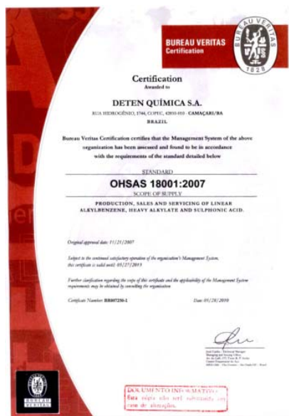
Certificado da OHSAS 18001