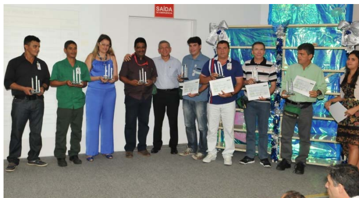
Premiação do Oficina de Ideias e Inovações

A DETEN reconheceu e premiou os empregados que apresentaram as melhores ideias e inovações que geraram impactos econômicos ou de relevância organizacional. Dentre as Ideias/Inovações registradas, 18 foram implantadas , das quais 10 foram premiadas .