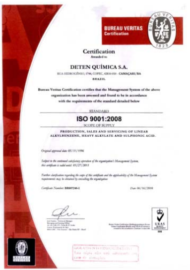
Certificado da ISO 9001

Em maio de 2013, a DETEN submeteu seu Sistema Integrado de Gestão Avançada - SIGA à Auditoria Externa de Recertificação nas normas: OHSAS 18001:2007, ISO 14001:2004 e ISO 9001: 2008, atendendo respectivamente a todos os requisitos da norma de Segurança e Saúde Ocupacional, Meio Ambiente e Qualidade.