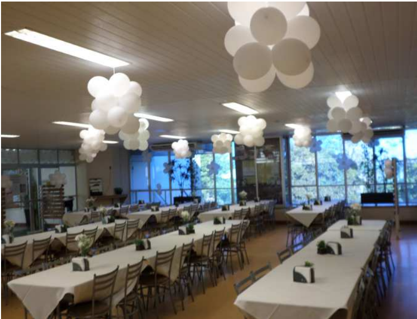
Refeitório em almoço festivo