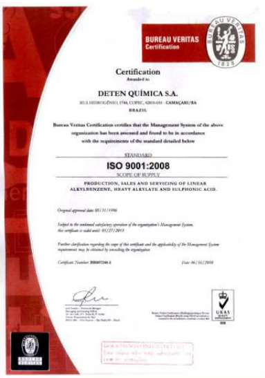
Certificado da ISO 9001