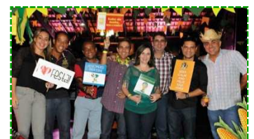
Comemoração do São João