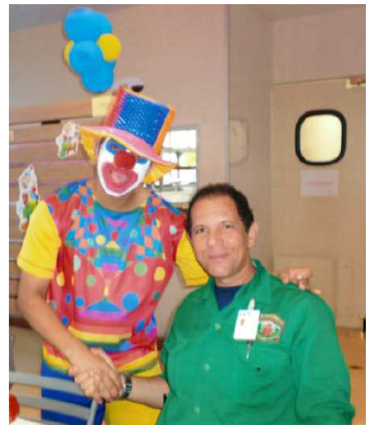
Comemoração do Dia das Crianças