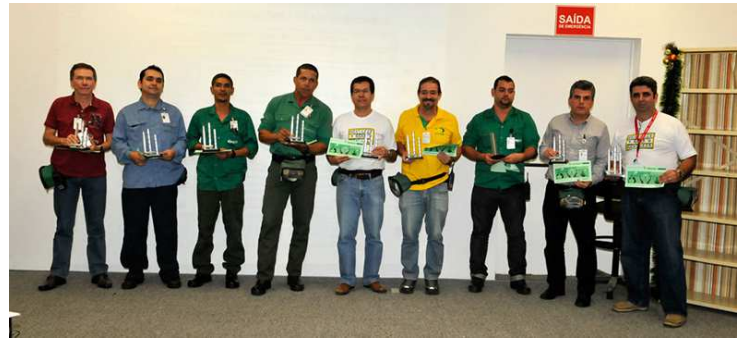
Premiação do Oficina de Ideias e Inovações 2014