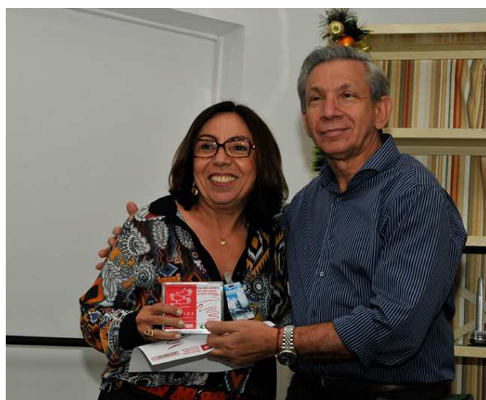
Instituto Chapada de Educação e Pesquisa – Projeto: Contratação de consultor e realização do Seminário Mobiliza. Público: Professores.