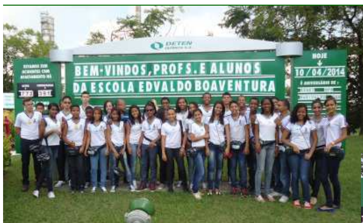
Visita de 37 alunos e professores da Escola Municipal Edivaldo Boaventura de Camaçari.

Ver de Dentro – Programa de visitas às empresas do Polo Industrial para manter as comunidades informadas sobre as atividades e controles de riscos do Complexo Industrial. Programa de visitas às empresas do Polo Industrial para manter as comunidades informadas sobre as atividades e controles de riscos do Complexo Industrial. A DETEN foi visitada em duas ocasiões, totalizando 85 pessoas entre alunos e professores das escolas Escola Edvaldo Boaventura (Camaçari) e Escola Altair da Costa (Dias d'Ávila).