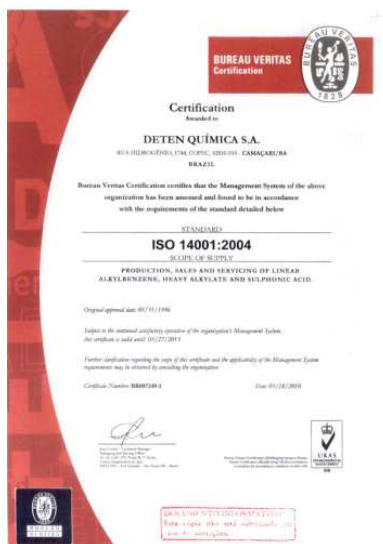
Certificado da ISO 14001