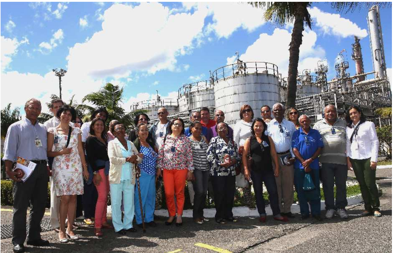
Integrantes do Conselho Consultivo recebidos na Empresa Oxiteno

Em dezembro de 1994, o Comitê de Fomento Industrial de Camaçari – COFIC - associação que representa as empresas do Polo Industrial de Camaçari - constituiu em um Conselho Consultivo, formado por representantes das comunidades vizinhas, com o objetivo de intensificar a aproximação do complexo industrial com essas comunidades. Funcionando há 20 anos, suas reuniões que acontecem a cada dois meses e tratam de temas como segurança industrial, saúde ocupacional, proteção ambiental e responsabilidade social. Um indicador da boa relação das empresas do complexo industrial com as comunidades vizinhas são as participações ativas nas reuniões e contribuições dos participantes. Em 2014, o Conselho Consultivo se reuniu 5 vezes.