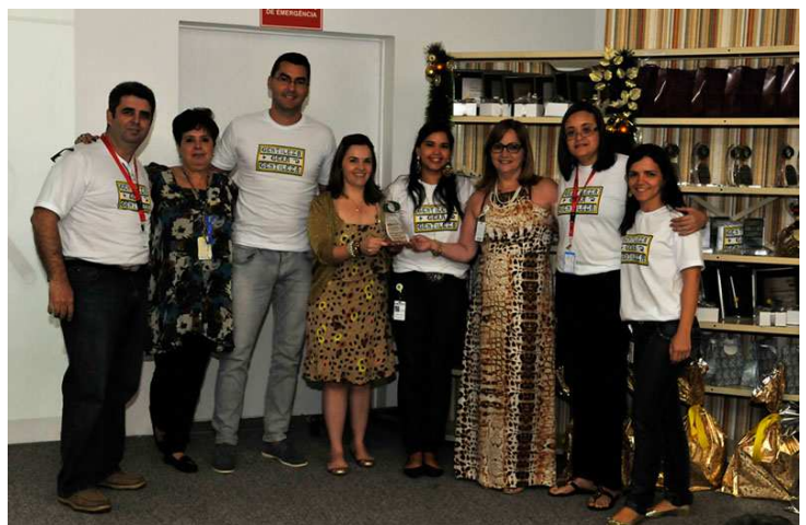
Área premiada – Destaque em Segurança: RECURSOS HUMANOS