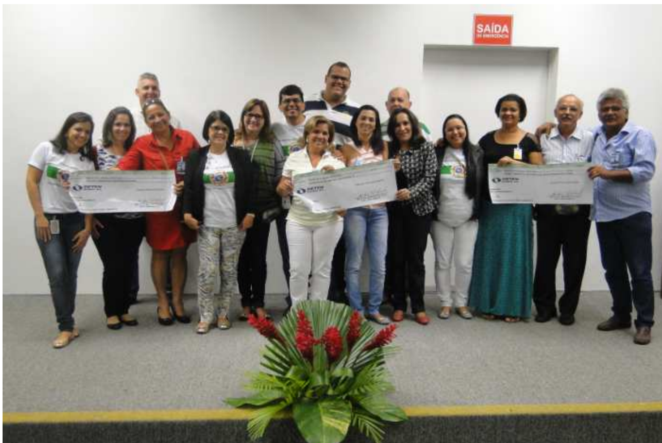
Entrega do Cheque Verde para as Entidades selecionadas em 2014

Em 2014 foram contempladas as seguintes instituições com o Cheque Verde 2014 : Associação de Amparo aos Idosos JR, Crerá – Centro de Recuperação Restauração das almas e Creche Comunitária Senhora Santana. Em 2014, o valor de doação do Cheque Verde foi aumentado em 42,5% em função da participação dos empregados na Pesquisa de Clima e Compromisso.