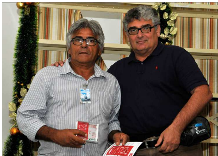
Centro de Recuperação e Restauração de Almas - CRERÁ – Projeto: construção de banheiros e lavanderia. Público: dependentes químicos.