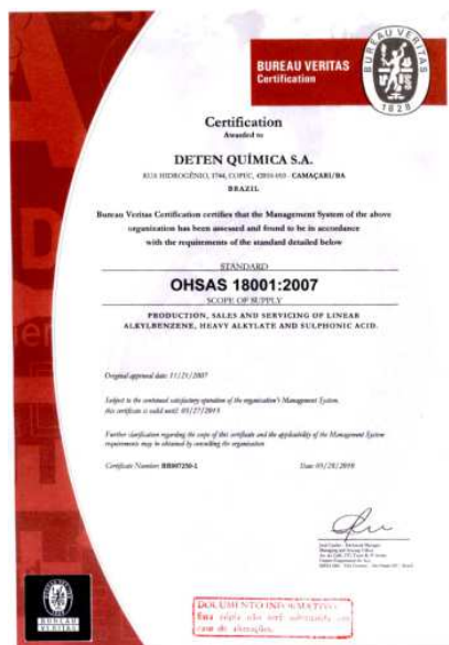
Certificado da OHSAS 18001