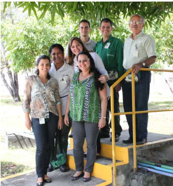
Comitê de Ergonomia

A DETEN, participando de Pool I de ônibus do Polo Industrial de Camaçari, oferece transporte aos empregados, estagiários e mão de obra temporária por meio de ônibus climatizados e em roteiros planejados que gerem o menor tempo possível de viagem.