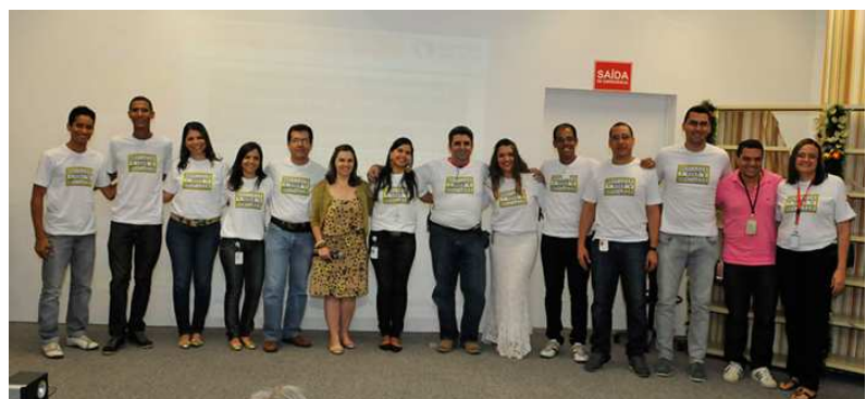
Apresentadores e Comissão Organizadora do evento