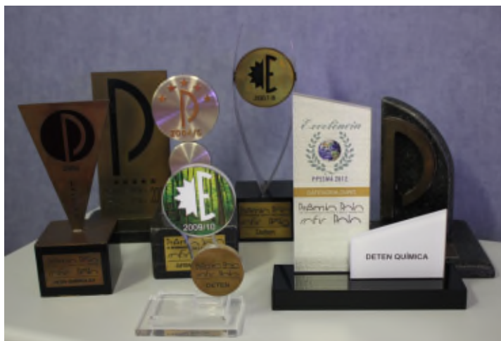
Troféus do Prêmio Polo – 2002 a 2014

Prêmio Polo de Segurança, Saúde Higiene e Meio Ambiente Em março 2014 a DETEN passou pela auditoria externa do COFIC – Comitê de Fomento Industrial de Camaçari, com base no novo Guia do Prêmio Polo do COFIC, que foi acrescido de mais três Elementos: 17 (Ergonomia), 18 (Segurança Patrimonial) e 19 (Integridade e Manutenção). A Empresa se manteve no patamar de excelência, obtendo a pontuação de 96% de conformidade, e se destacando mais uma vez como a empresa melhor pontuada entre todas as 22 empresas participantes do prêmio. Este resultado demonstra o alinhamento da Empresa com as questões de SSHMA.