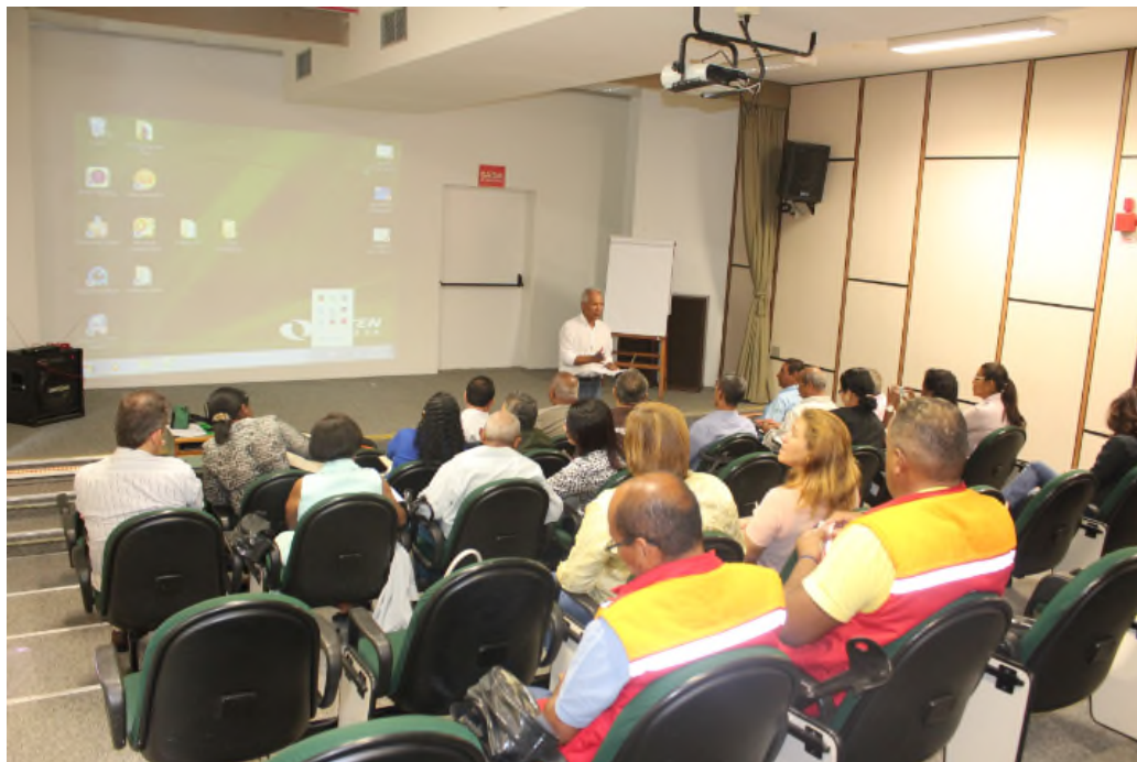
Conselho Consultivo realizou reunião nas dependências da DETEN

Em dezembro de 1994, o Comitê de Fomento Industrial de Camaçari – COFIC - associação que representa as empresas do Polo Industrial de Camaçari - constituiu em um Conselho Consultivo, formado por representantes das comunidades vizinhas, com o objetivo de intensificar a aproximação do complexo industrial com essas comunidades. Funcionando há 20 anos, suas reuniões que acontecem a cada dois meses e tratam de temas como segurança industrial, saúde ocupacional proteção ambiental e responsabilidade social. Um indicador da boa relação das empresas do complexo industrial com as comunidades vizinhas são as participações ativas nas reuniões e contribuições dos participantes. Em 2015, o Conselho Consultivo se reuniu 5 vezes.