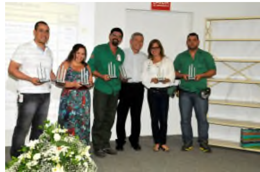
Premiação do Oficina de Ideias e Inovações 2015