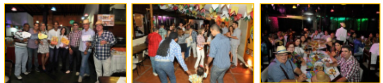
Comemoração do São João

A Empresa investe em apoio ao grêmio de empregados na promoção de confraternizações tradicionais (Natal, São João, Dia das Mães, Dia dos Pais e Dia das Crianças). O GREDE oferece aos associados diversas opções de lazer e convênios com clube social, estabelecimentos comerciais e escolas, realização de exposições, distribuição de brindes (ingressos de cinema, Ovos de Páscoa, Brinde Junino, presente para aniversariante), promovendo desta forma a integração e a motivação dos empregados associados.