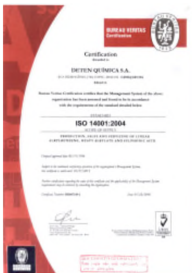
Certificado da ISO 14001