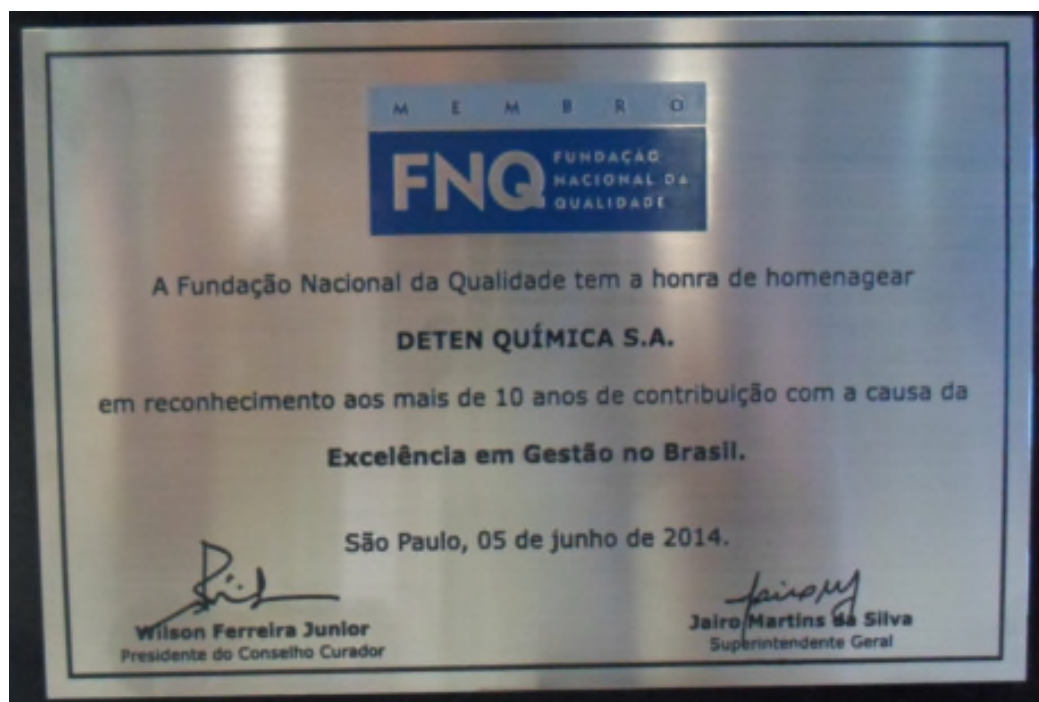
Placa comemorativa da FNQ

Em 2011 a Deten recebeu homenagem por ter sido a empresa que mais contribuiu com o Banco de Boas Práticas da FNQ. As práticas aprovadas ficam disponíveis para consulta de todas as empresas associadas a Fundação.