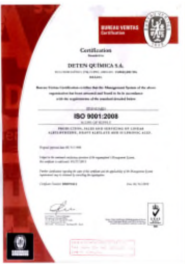
Certificado da ISO 9001