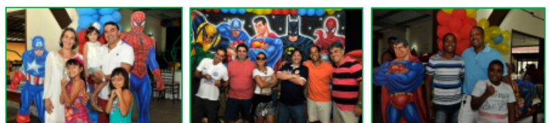
Comemoração dia dos Pais