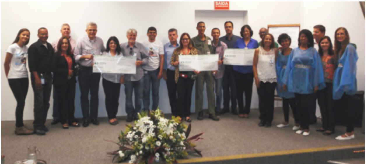
Entrega do Cheque Verde para as Entidades selecionadas em 2015

No total Foram doadas aproximadamente 11 toneladas de papel, papelão e plástico para a Cooperativa de Matérias Recicláveis de Camaçari – COOPMARC. Além desses materiais, a DETEN recicla lâmpadas, óleo lubrificante, pilhas e baterias, entre outros.