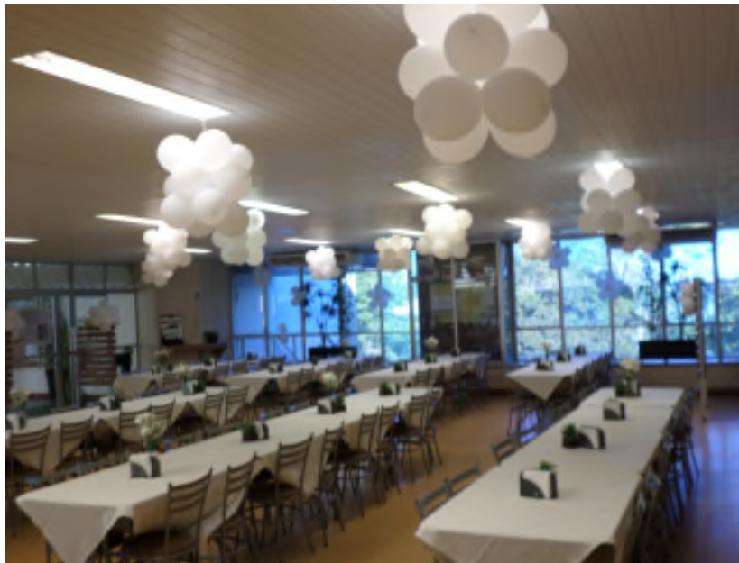
Refeitório em almoço festivo