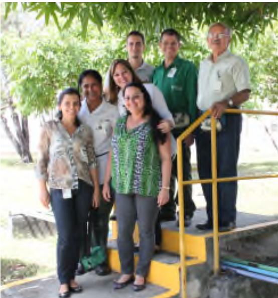
Comitê de Ergonomia

A DETEN, participando de Pool I de ônibus do Polo Industrial de Camaçari, oferece transporte aos empregados, estagiários e mão de obra temporária por meio de ônibus climatizados e em roteiros planejados que gerem o menor tempo possível de viagem.