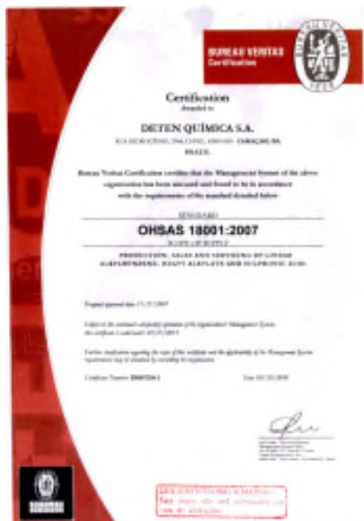
Certificado da OHSAS 18001