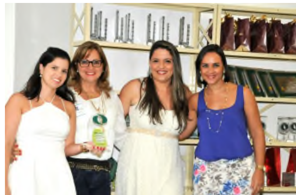
Área premiada – Destaque em Segurança: FINANCEIRA