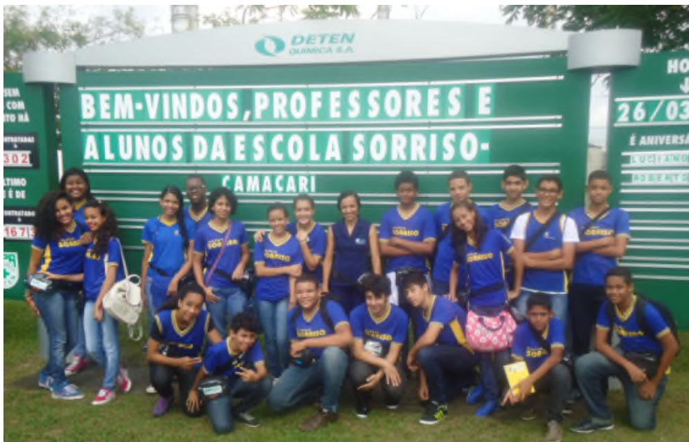
Professores e Alunos da Escola Sorriso - Camaçari

Ver de Dentro – Programa de visitas às empresas do Polo Industrial para manter as comunidades informadas sobre as atividades e controles de riscos do Complexo Industrial. No dia 26 de março, a DETEN recebeu a visita de 24 alunos e 3 professores da Escola Sorriso, localizada na cidade de Camaçari.