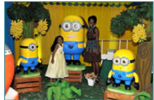
Comemoração do Dia das Crianças